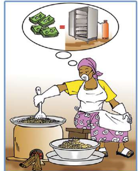
Une transformatrice de produits agricoles a aussi besoin des SFD pour évoluer.