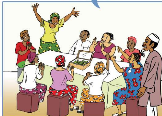
L'expérience de l'épargne comme les tours de tontine de quartier prédispose aussi à une bonne relation avec les SFD...