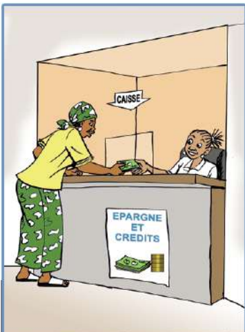
Avoir l'habitude de l'épargne est un atout pour contracter et gérer un crédit.