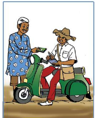
... ou encore les cotisations traditionnelles chez les tontiniers ambulants