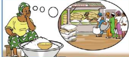
Une commerçante éprouvant des besoins pour développer son activité est éligible à un contrat de crédit auprès d'un SFD...