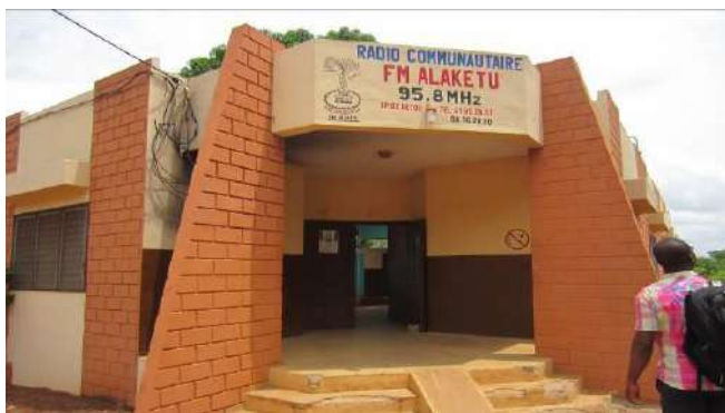
Tableau 12 : RADIO ALAKETU